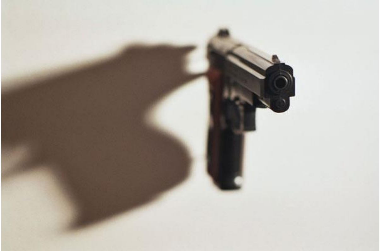
Objektinstallation literarischer Raum

„Ihr seid entweder auf unserer Seite oder auf der Seite der Terroristen“, verkündete Präsident Bush mit Blick in den Nahen Osten. Der Terror (lat. Furcht, Schrecken), verkünden unsere Politiker, werde die Welt verändern, eine neue Art von Krieg sei entstanden, gegen einen Gegner, der nicht zu besiegen sei. Eine Generation nach der anderen werde Konzessionen an ihre Freiheit machen müssen, um in Sicherheit leben zu können.