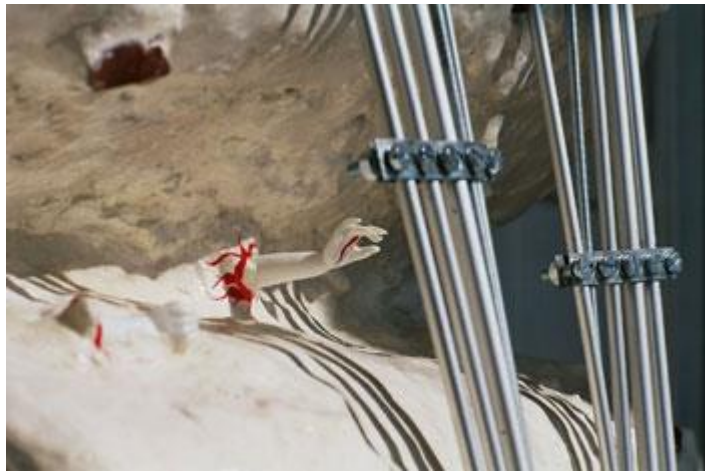
Aus Zyklus 12, „Blutende Erde“, Tag des rauens Gipscollage, 75x46, 4,5 kg

In der Vergangenheit gab es bereits Fälle, die als Operation unter falscher Flagge in die Geschichte eingingen.