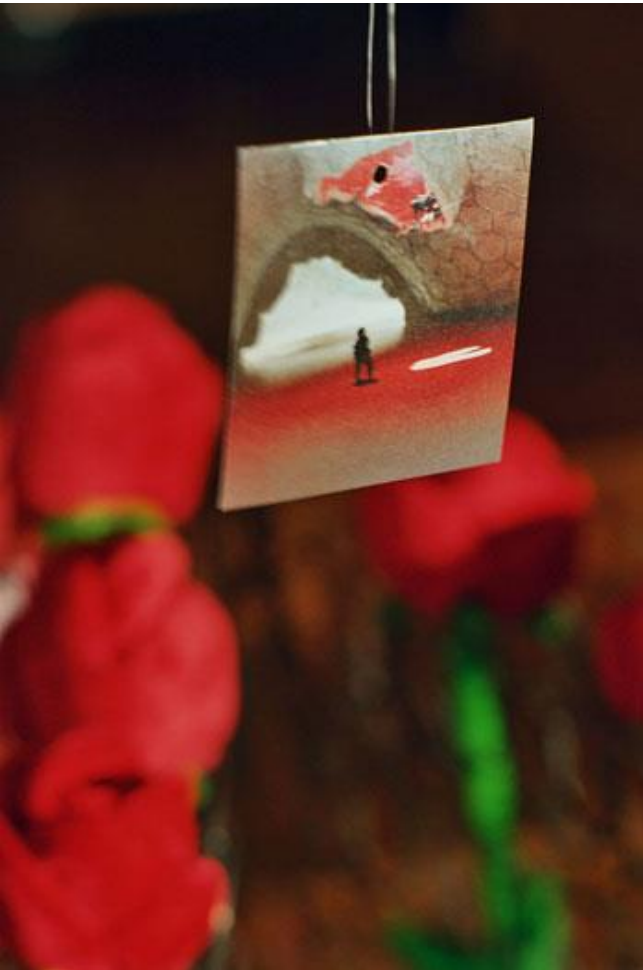
Objektinstallation im literarischen Raum

Der 11. September 2001 hat in der Tat gezeigt, wie verwundbar unsere demokratischen Werte sind, als Islamisten des Terrornetzwerkes Al-Qaida zwischen 8.10 Uhr und etwa 9.30 (UTE-4) vier Verkehrsflugzeuge entführten, zwei davon in die Türme des World Trade Center in New York City lenkten, das dritte in das Pentagon in Arlington, Virginia und ein weiteres Flugzeug nach Kämpfen zwischen Attentätern und Besatzung sowie Fluggästen in der Nähe von Pittsburgh, Pennsylvania abstürzte. Wir alle erinnern uns noch an die dramatischen Bilder verzweifelter Menschen, die, als das World Trade Center einstürzte, um ihr Leben rannten, soweit sie nicht bereits verschüttet waren. Andere sprangen in ihrer Verzweiflung aus dem Fenster in den sicheren Tod. Bilder, die unvergessen bleiben! 3003 Tote forderte das Attentat.