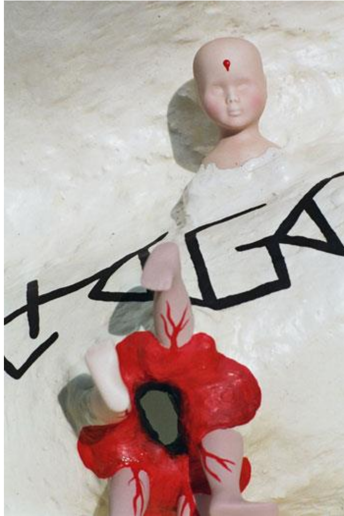
Aus Zyklus 12, "Blutende Erde", Neue Welten , Gipscollage, 70x50, 5kg

K ann es tatsächlich für uns von Nutzen sein, demokratische Werte zugunsten von staatlicher oder wirtschaftlicher Kontrolle immer weiter einschränken zu lassen?